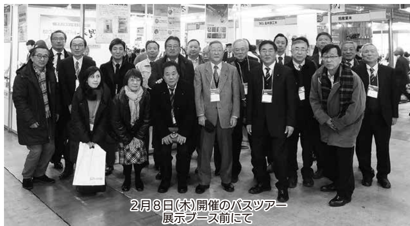
2月8日(木)開催のバスツアー 展示ブース前にて

39回を迎えた今回は、会場面積を13,300㎡と従来の1.3倍に出展スペースを大幅に拡大。拡大に伴い出展ゾーンを「加工技術」「機器・装