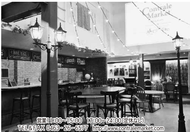
営業11:00~15:00 17:00~24:00(定休なし) TEL&FAX 0463-26-6577 http://www.contralemarket.com