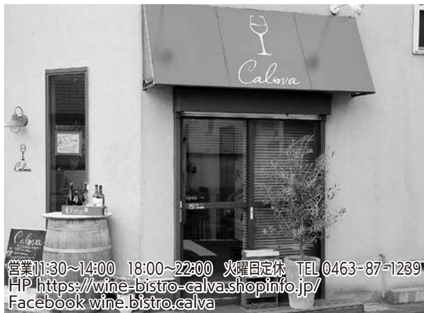
営業11:30~14:00 18:00~22:00 火曜日定休 TEL 0463-87-1239 HP https://wine-bistro-calva.shopinfo.jp/ Facebook wine.bistro.calva

今回は、渋谷駅南口徒歩一分の好立地で、ワインビストロを営むワインビストロカルバ(曲