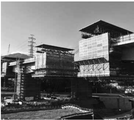
秋山高架橋の架設工事