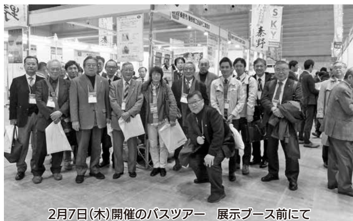
2月7日(木)開催のバスツアー 展示ブース前にて