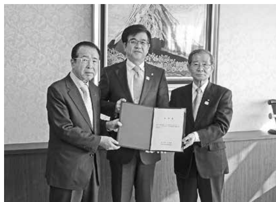
市へ要望書を提出

秦野は、多彩な観光資源を有し、交通の利便性も高い「山紫水明」の地でありながら、情報発信の拠点がなく、「登山」以外の観光知名度は高くない。たばこ産業の跡地は、国が進めるイ