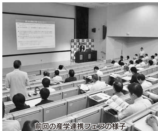
前回の産学連携フェアの様子

織「対組織」の本格的な産学連携を実現するきっかけを提供すべく、対象領域の近い研究者が集う研究所の取組みや、複数分野の研究者が連携する研究グループの活動をポスターセッション形式で紹介する。基調講演では、技術発展著しい中国における産学連携の状況や、企業のグリーンエネルギー戦略に関して、講演が予定されている。 複数の分野の研究者と直接交流できる貴重な機会となっております。産学連携に興味のある方はぜひ参加を！ 日時 8月7日(水)13時~18時半 会場 東海大学高輪キャンパス(2号館) (東京都港区高輪2-3-23) 主催 東海大学 研究推進部 産官学連携センター お問い合わせ 電話 0463-59-4364 http://www.u-tokai.ac.jp/research/fair/2019/