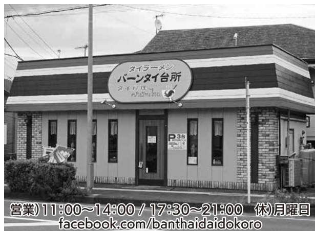
営業)11:00~14:00 / 17:30~21:00 (休)月曜日 facebook.com/banthaidaidokoro

同氏は、タイの首都バンコク出身、22年前に来日し秦野にやってきた。タイでは祖母が飲食店を営んでおり、幼いころから店の手伝いをするなかでタイの家庭料理の仕込みや調理、接客を覚えた。来日後は、「タイ料理を多くの秦野の人達に知ってもらえる店を持ちたい」という想いで、製造業の仕事を続けながら、市内のイベントに出店し、料理を提供してきた。地道な努力の末、平成26年に念願のお店を開業、多くの仲間を支えられ、今春節目の5周年を迎えた。メニューは、トムヤムクンラーメンやグリーンカレーラーメンなどのタイラーメンを中心に、焼き物や揚げ物とサラダなど様々なタイの家庭料理、屋台の味が食べられる。タイ料理の特徴は何と云ってもエスニックな辛さにあるが、「辛い料理が苦手」という方や子供でもおいしく食