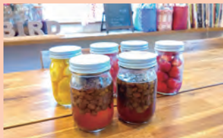
(上)自家製天然酵母