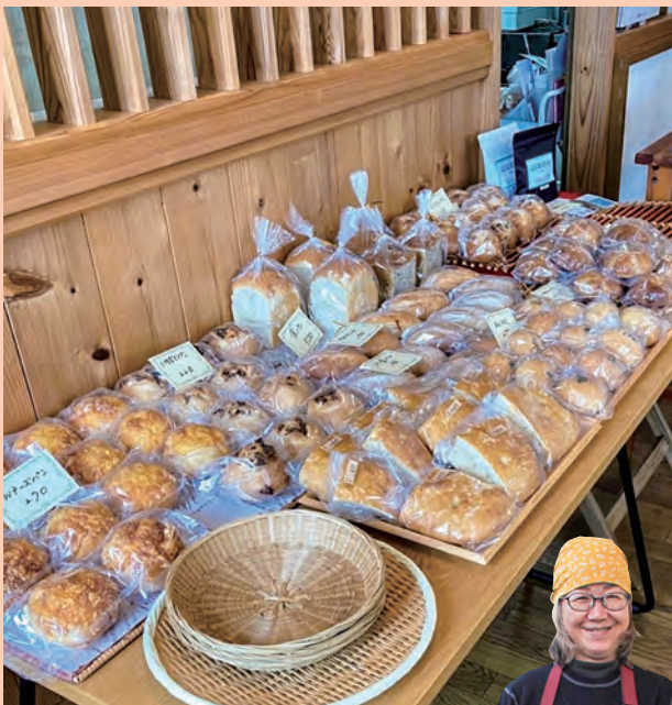
(左)毎月15日 ドーナツ・冷凍パン販売