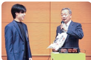
10秒チャレンジの様子

続いて新入会員の紹介が行われ、温かい拍手に包まれ、歓迎ムードとなった。 交流懇親会では豪華景品が当たるお楽しみ抽選会、初企画の10秒チャレンジが行われ、会場は大いに盛り上がりを見せた。終始和やかな雰囲気の中、普段はやりとりのない事業所同士も交流を深めていた。