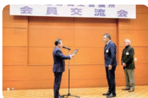
100年企業記念の盾贈呈