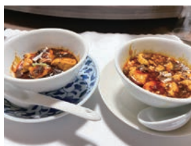
店舗の鹿肉麻婆豆腐とレトルト商品の比較試食を実施

『秦野ジビエ』を市の観光資源に育てたいという熱意を持っています。ただ、鹿やイノシシは捕獲量に変動があるため、『希少価値があるもの』として捉えてほしいですね。今後は、『秦野』といえば落花生と蕎麦そしてジビエと誰もが思い浮かべる名物にするため、行政にさらなるバックアップをお願いしたいと考えています。また、食肉利用だけでなく、鹿革などを含めた資源の有効活用という『ジビエ』本来の精神のもと、地域一体となった活性化を目指しています。高タンパクで鉄分が豊富なジビエを広めることで、猟友会・商工会議所・市民が連携し、まち全体の活性化につなげていきたいと思っています。