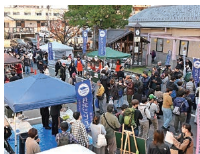
各店舗には長い行列ができていた