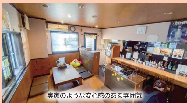
実家のような安心感のある雰囲気