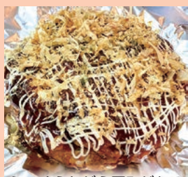
ふっくらながら厚みがある お好み焼き 食べ応え抜群！