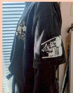
友人が開店祝いでプレゼント！ 店員おそいのTシャツ