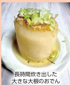
長時間炊き出した 大きな大根のおでん