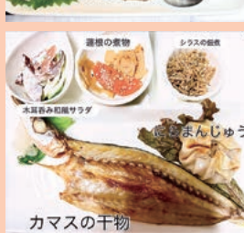
総菜あふれる屋の定食(結定食)