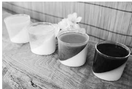
はだのブランドに認証された「はだの日和」 ご注文はこちら→☎0463-68-5710 http://tokiwa-sweets.com/ Facebookも更新中、是非ご覧ください

平成29年6月には、商品を通してより多くの人々に秦野の魅力を伝えるため、秦野市が公募した「はだのブランド認証制度」に出品。厳正な審査を経て、今秋見事に「はだのブランド」として認証された。認証された商品「はだの日和」は、秦野産の